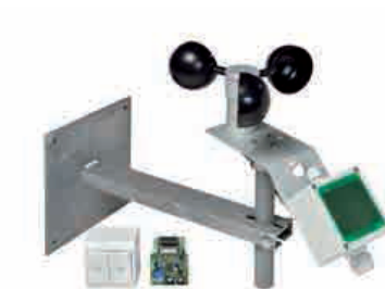
Komfortpaket: Vind och regngivare, insticksmodul och tryckknappenhet.

Svita Smoke Vent brandgasventilatorer har ett vägt u-värde på 9 W/m 2 °C.